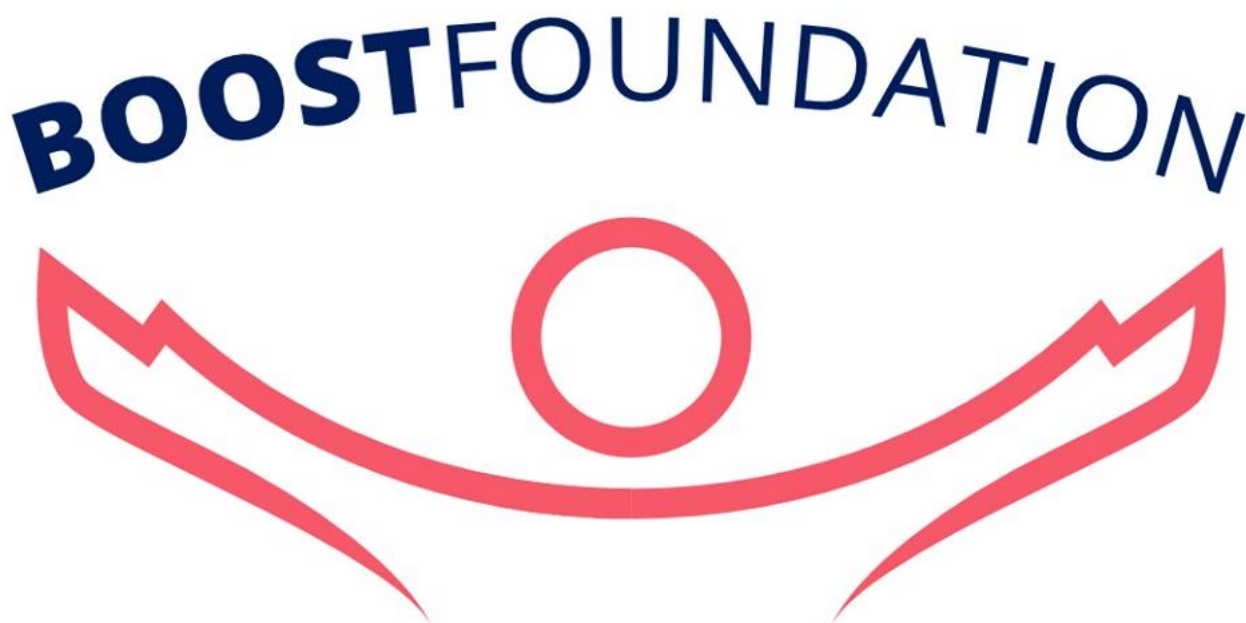
Figuur 2: Boost Foundation "Together we change the world"